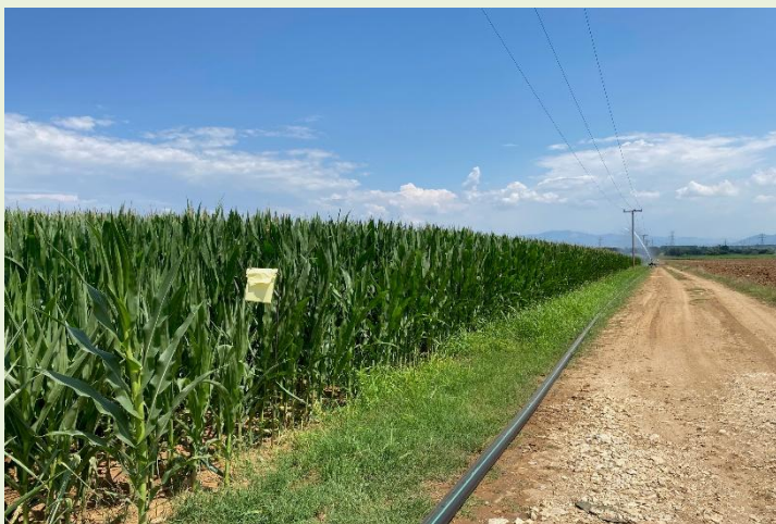
Εικόνα 1 Π.Κ.Π.Φ.Π.Φ.Ε Καβάλας

Το έντομο έχει μία γενεά ανά έτος και προσβάλλει κυρίως τον αραβόσιτο. Η ζημιά που προκαλεί στο ριζικό σύστημα η νεαρή προνύμφη (εκκόλαψη των αυγών τον Μάιο μήνα), έχει ως αποτέλεσμα τη μη επαρκή θρέψη των φυτών. Η δραστηριότητα των προνυμφών περιορίζεται στο έδαφος ενώ τα ενήλικα πετούν σε μεγάλες αποστάσεις προς ανεύρεση τροφής. Η προσβολή προκαλεί κακή στήριξη και ελλιπή θρέψη με αποτέλεσμα το πλάγιασμα των φυτών και συνέπεια τη μείωση της παραγωγής.