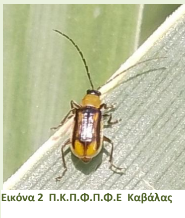
Εικόνα 2 Π.Κ.Π.Φ.Π.Φ.Ε Καβάλας

Το πρόγραμμα υλοποιείται σύμφωνα με το υπ.αριθμ.: 157885/17-06-2026 έγγραφο της Διεύθυνσης Προστασίας Φυτικής Παραγωγής (Τμήμα Προστασίας Φυτών) του Υπ.Α.Α.Τ.