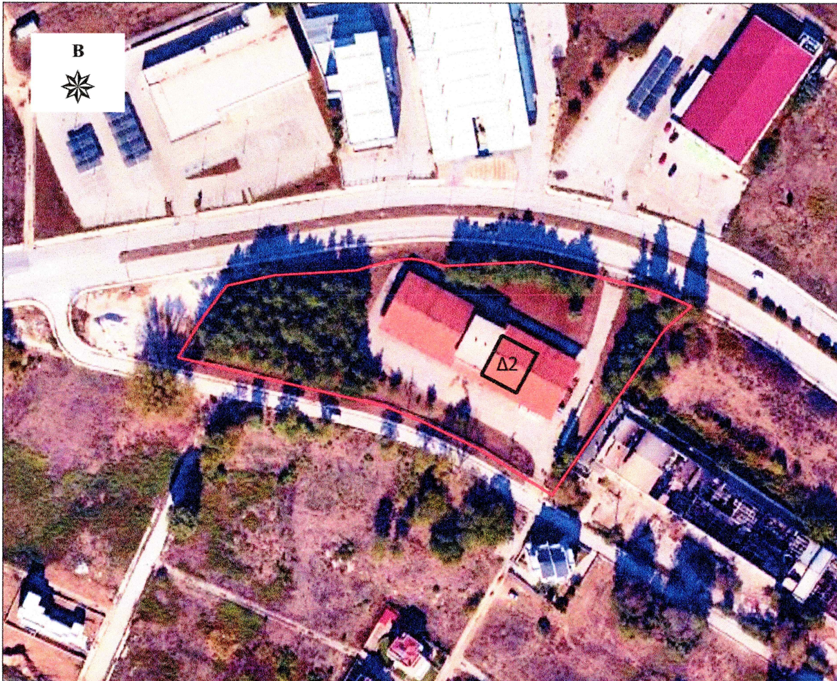
Πίνακας Συντεταγμένων του γηπέδου με κορυφές Α,Β,Γ,....,Ω3,Ω4,Α Εμβαδόν γηπέδου = 9654.12 τ.μ.

ΔΙΑΓΡΑΜΜΑ ΚΤΗΜΑΤΙΚΗ ΠΕΡΙΟΧΗ ΚΟΜΟΤΗΝΗΣ ΑΠΟΘΗΚΗ (Δ2): τμήμα ΚΑΕΚ420171591003 ΕΜΒΑΔΟΝ : 257,50 τ.μ. ΚΛΙΜΑΚΑ : 1 : 2.000