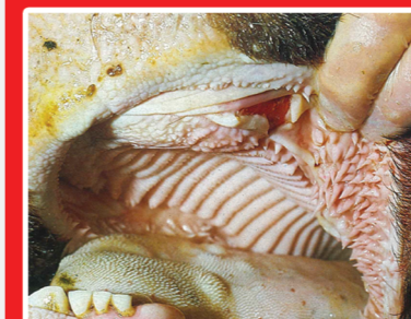
Έλκη και φυσαλίδες στην γλώσσα