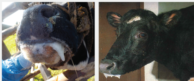
Έντονη σιελόρροια σε βοοειδές