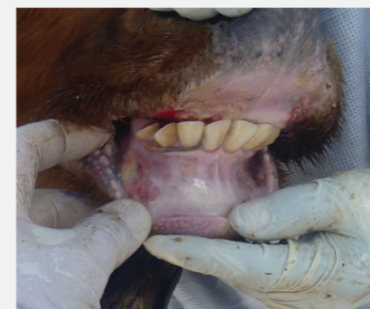
Έλκη και διαβρώσεις στα ούλα βοοειδούς