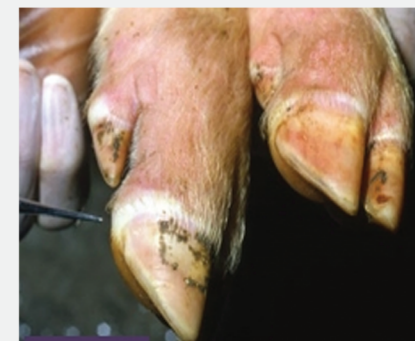
Αλλοιώσεις στη στεφάνη άκρου χοίρου