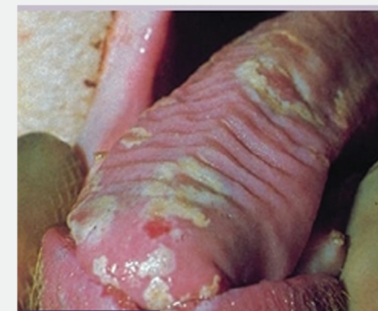
Αλλοιώσεις στη γλώσσα χοίρου