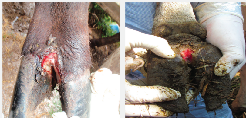
Έλκος στο μεσοδακτύλιο διάστημα ύστερα από φυσαλίδα που έχει διαρραγεί