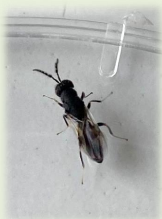
Εικόνα: 1Ενήλικο άτομο Ευρύτομου Π.Κ.Π.Φ.Π.& Φ.Ε.-ΚΑΒΑΛΑΣ 2026

Από επιτόπιους ελέγχους στο δίκτυο εγκατεστημένων κλωβών, στην Π.Ε Καβάλας, για την παρακολούθηση του εντόμου από την υπηρεσία μας και σε συνέχεια του δελτίου, με αριθμό 13/21-04-2026 , η έξοδος του εντόμου συνεχίζεται. Επιπλέον, δεν παρατηρήθηκε ακόμη το στάδιο σκλήρυνσης του ενδοκαρπίου.