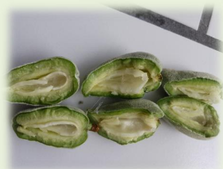
Π.Κ.Π.Φ.Π.& Φ.Ε.-ΚΑΒΑΛΑΣ 2026

Σύμφωνα με τα παραπάνω, πρέπει να εφαρμοστεί άμεσα επαναληπτικός ψεκασμός , ιδιαίτερα σε περιπτώσεις όπου δεν έχει πραγματοποιηθεί, καθώς και σε αμυγδαλεώνες με γνωστό ιστορικό προσβολών.