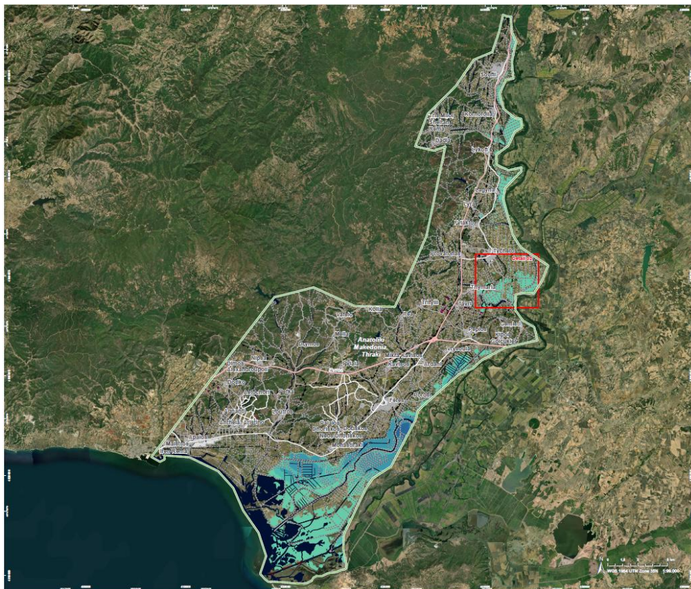
Εικόνα 1: Πλημμυρισμένες εκτάσεις στο νομό Έβρου στο νότιο τμήμα την 27-02-2026