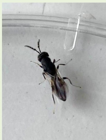
Εικ. 1. Ενήλικο άτομο Ευρύτομου 2026 (Π.Κ.Π.Φ.Π.& Φ.Ε.-ΚΑΒΑΛΑΣ)

Από ελέγχους επιτόπιους και παρατηρήσεις στο δίκτυο εγκατεστημένων κλωβών για την παρακολούθηση του εντόμου, διαπιστώθηκε η έναρξη της πτήσης στην Περιφερειακή Ενότητα Καβάλας.