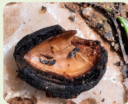
Εικ 3. Ενήλικα άτομα ευρύτομου σε κέλυφος αμυγδάλου (Π.Κ.Π.Φ.Π.& Φ.Ε.-ΚΑΒΑΛΑΣ)

Τονίζεται ότι οι ψεκασμοί πραγματοποιούνται με ηλιοφάνεια κατά τις θερμές ώρες της ημέρας, οπότε και παρατηρούνται μεγαλύτεροι πληθυσμοί του εντόμου σε δραστηριότητα. Δεν συνιστάται ψεκασμός τις ημέρες με συννεφιά γιατί δεν καταγράφεται σημαντική δραστηριότητα του εντόμου.