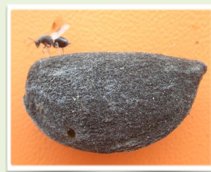
Εικ 2. Ευρύτομο (Π.Κ.Π.Φ.Π.& Φ.Ε.-ΚΑΒΑΛΑΣ)

Επισημαίνεται ότι η δραστηριότητά του εντόμου κατά την έξοδο του διαρκεί, 20-25 ημέρες. Το ευρύτομο θεωρείται από τους πιο σημαντικούς εχθρούς της καλλιέργειας και η μη έγκαιρη αντιμετώπισή του μπορεί να επιφέρει σημαντική οικονομική ζημιά στην παραγωγή.