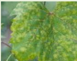
Εικ. 2 Προσβολή φυλλώματος αμπελιού από ωίδιο.

Θεωρείται από τις πιο σοβαρές ασθένειες στο αμπέλι. Η μη έγκαιρη αντιμετώπιση της ασθένειας έχει ως αποτέλεσμα τη μείωση της παραγωγής ποιοτικά και ποσοτικά. Ο μύκητας διαχειμάζει σε ξυλώδεις βλαστούς και σε φυτικά υπολείμματα που παραμένουν στο έδαφος για μεγάλο χρονικό διάστημα. Η ασθένεια εμφανίζεται κατά την έκπτυξη της νέας βλάστησης. Ευνοείται από σχετικά υψηλές θερμοκρασίες και αυξημένη ατμοσφαιρική υγρασία. Προσβάλλει φύλλα, βλαστούς και βότρες. Χαρακτηριστικό σύμπτωμα της ασθένειας είναι το λευκό επίχρισμα στα προσβεβλημένα μέρη.