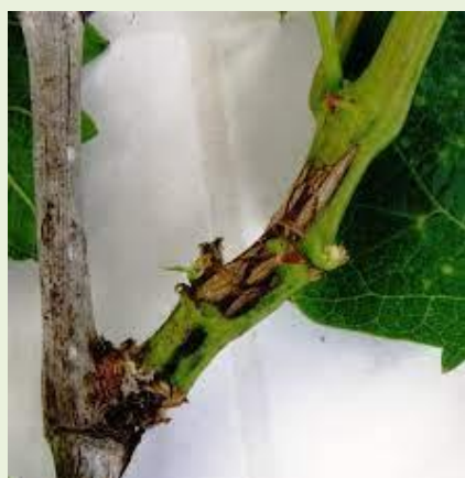
Εικ. 1 Φόμοψη σε ετήσιο βλαστό.

Η ασθένεια προκαλεί σημαντική ζημιά ιδιαίτερα όταν οι καιρικές συνθήκες είναι ευνοϊκές την τρέχουσα περίοδο. Ο μύκητας διαχειμάζει στο φλοιό προσβεβλημένων κληματίδων. Βροχοπτώσεις και ήπιες σχετικά θερμοκρασίες από τον Φεβρουάριο έως και τον Απρίλιο, ευνοούν την εμφάνιση της ασθένειας. Ο μύκητας προσβάλλει ετήσιους βλαστούς, φύλλα και βότρες. Η μεγαλύτερη προσβολή παρατηρείται στα μεσογονάτια διαστήματα και πιο κοντά προς την βάση της κληματίδας. Κατά την προσβολή δημιουργούνται σκουρόχρωμες νεκρωτικές κηλίδες που εξελίσσονται σε έλκη και επιμήκη σχισίματα. Σε έντονες προσβολές οι κληματίδες γίνονται πιο εύκαμπτες και κατά συνέπεια πιο εύθραυστες. Στα φύλλα εμφανίζονται κυκλικές νεκρωτικές κηλίδες κίτρινου χρώματος με σκούρο κέντρο. Τα προσβεβλημένα από τον μύκητα φύλλα, ξηραίνονται και πέφτουν.