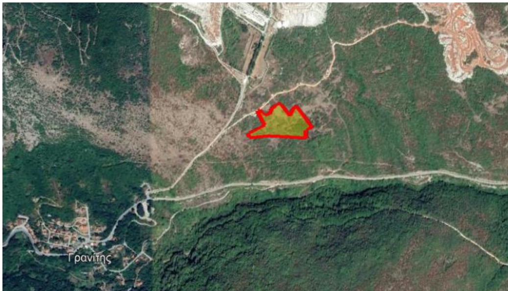
Απόσπασμα Google Earth.