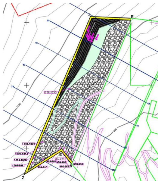
Εικόνα 9. Απόσπασμα χάρτη «Χάρτης Τελικής Κατάστασης».

Εξορυκτικά απόβλητα: Τα στείρα υλικά θα αποτίθενται σε βαθμίδες στο βορειοανατολικό και νότιο τμήμα του χώρου στα υψόμετρα δαπέδου των: +958, έως και +1036 μέτρων. Θα δημιουργηθούν 11 βαθμίδες απόθεσης στείρων. Οι βαθμίδες των στείρων θα έχουν μέγιστο ύψος 8 μέτρα και πλάτος τουλάχιστον 6 μέτρα. Οι βαθμίδες απόθεσης των στείρων υλικών θα εξοφλούνται σταδιακά και θα ακολουθεί η αποκατάστασή τους με τη δημιουργία φυτεύσεων τόσο στα δάπεδα όσο και τα πρανή των βαθμίδων.