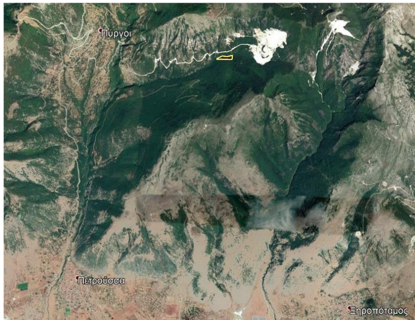
Απόσπασμα ευρύτερης περιοχής

Η περιοχή που πρόκειται να γίνουν οι εργασίες εκμετάλλευσης, είναι ορεινή ημιορεινή δασική έκταση, με κλίση της τάξης του 45%, σε υψόμετρο 770 - 850 περίπου μέτρων. Η βλάστηση που υπάρχει στην περιοχή αποτελείται κυρίως από πλατύφυλλα φυλλοβόλα είδη.