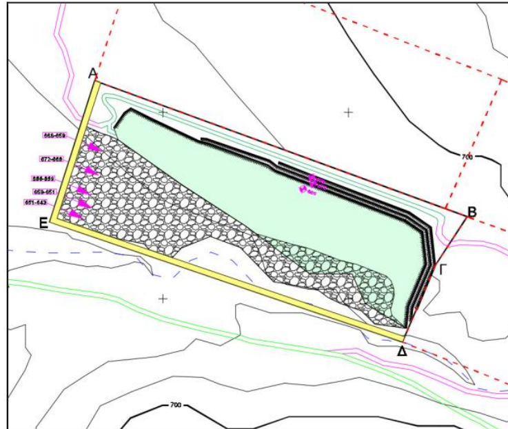
Απόσπασμα χάρτη τελικής κατάστασης εκμετάλλευσης

δαπέδων των βαθμίδων θα είναι τουλάχιστον 6 μέτρα και η μέγιστη κλίση των πρανών θα είναι της τάξης των 45ο ώστε η κλίση του τελικού πρανού των βαθμίδων απόθεσης να είναι μικρότερη του 60%. Οι βαθμίδες απόθεσης των στείρων υλικών θα εξοφλούνται σταδιακά και θα ακολουθεί η αποκατάστασή τους με τη δημιουργία φυτεύσεων τόσο στα δάπεδα όσο και τα πρανή των βαθμίδων. Ο χώρος απόθεσης των στείρων θα έχει έκταση περίπου 33,9 στρέμματα.