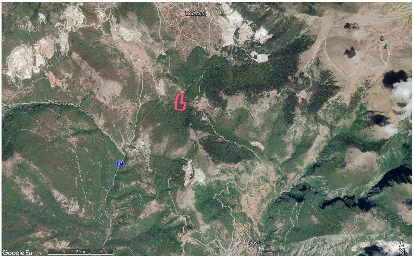
Αεροφωτογραφία της ευρύτερης περιοχής μελέτης

Η περιοχή που πρόκειται να γίνουν οι εργασίες εκμετάλλευσης, είναι ορεινή ημιορεινή δασική έκταση, με κλίση της τάξης του 50%, σε υψόμετρο 1000 - 1150 περίπου μέτρων. Η βλάστηση που υπάρχει στην περιοχή αποτελείται κυρίως από πλατύφυλλα είδη.