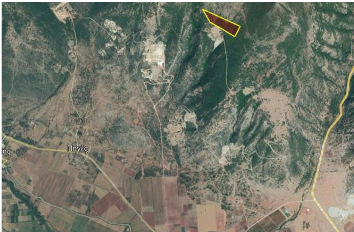
Απόσπασμα Google Earth.