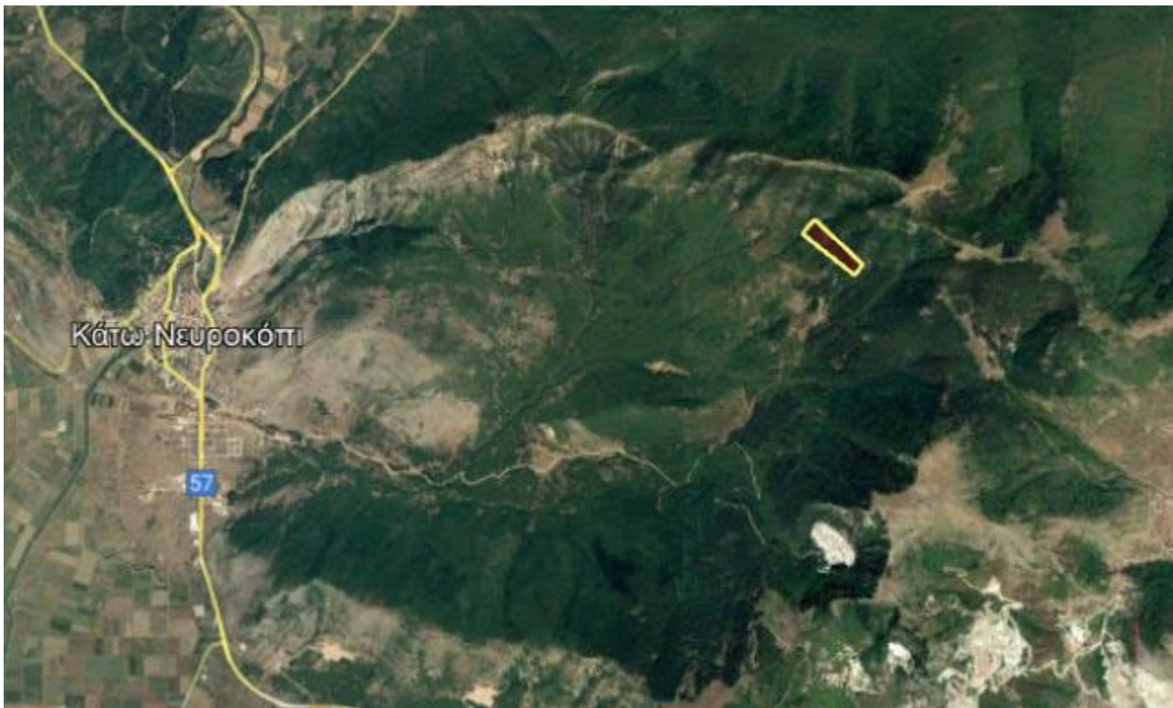
Απόσπασμα Google Earth.