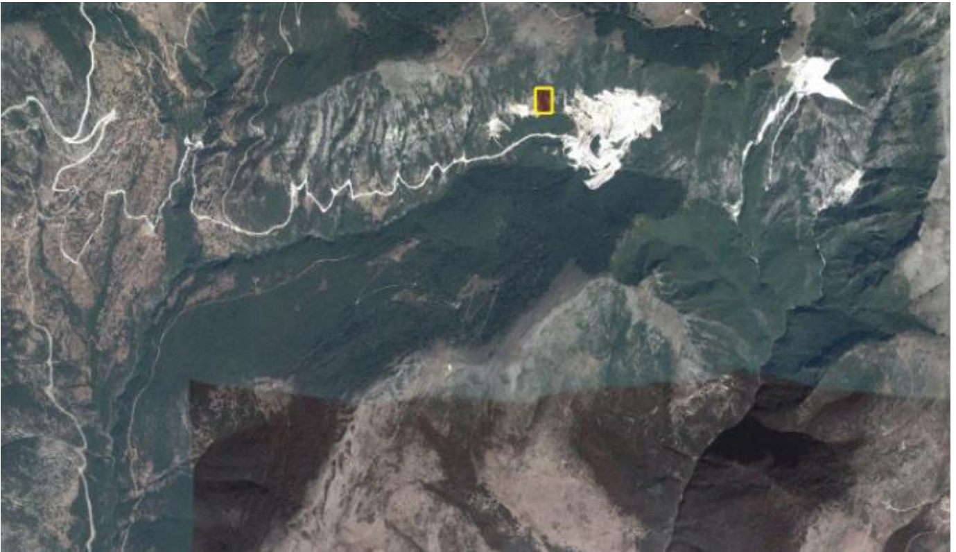
Απόσπασμα χάρτη προσανατολισμού.