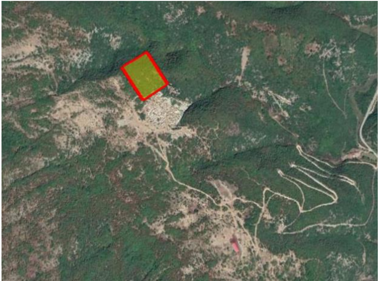
Απόσπασμα Google Earth.