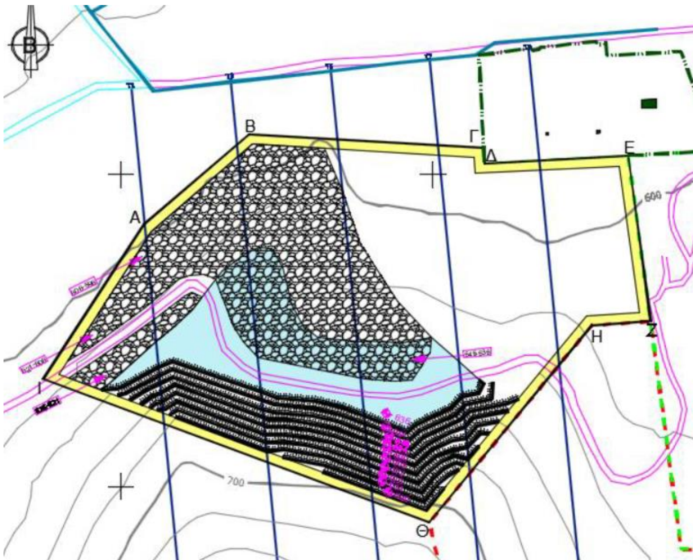
Απόσπασμα χάρτη «Χάρτης Τελικής Κατάστασης».

Η αποκατάσταση θα γίνει σε 3 φάσεις, όπως φαίνεται στο σχετικό διάγραμμα που υπάρχει στη μελέτη. Οι φάσεις αυτές περιγράφονται στον παρακάτω πίνακα.