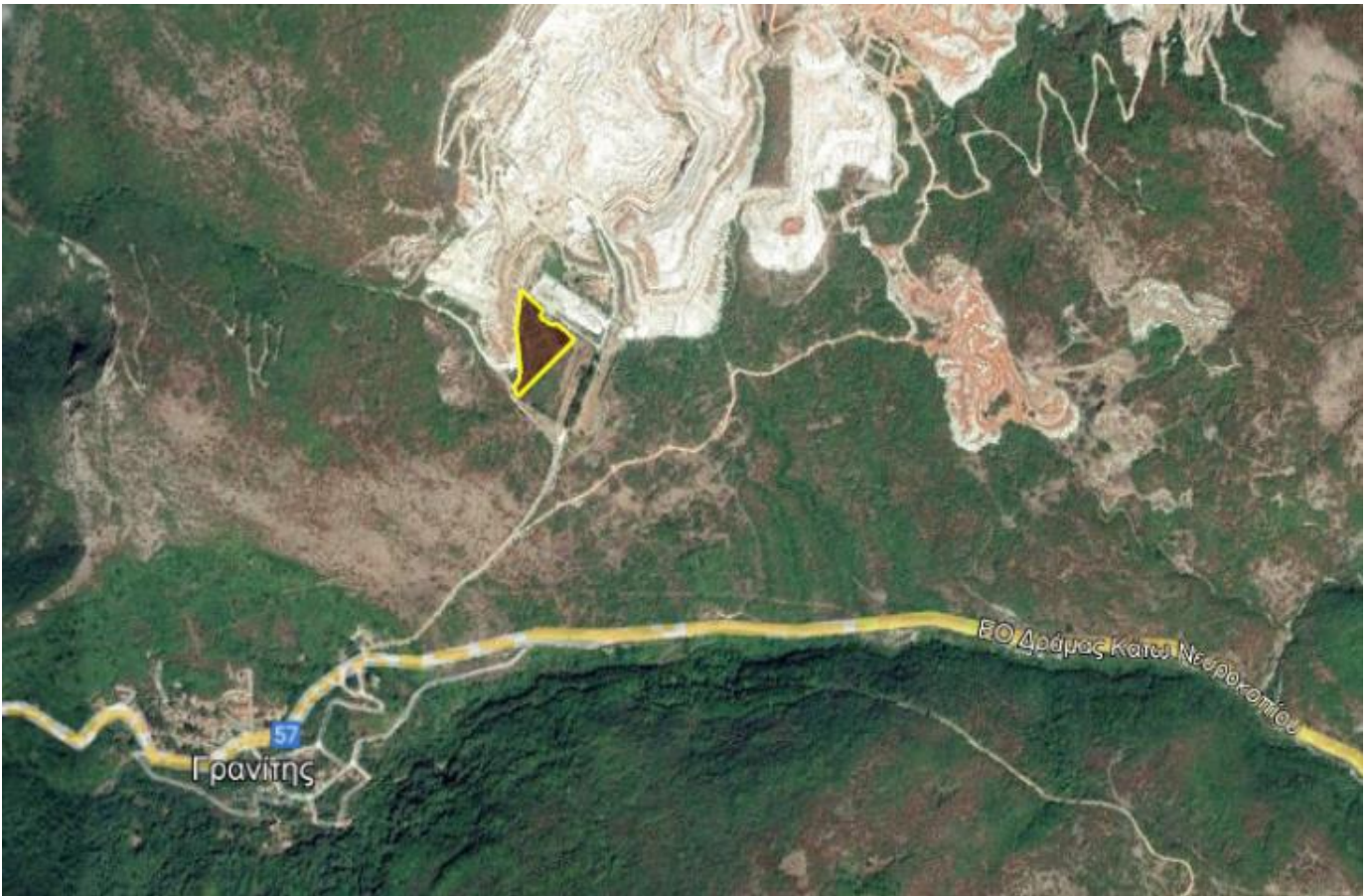
Απόσπασμα Google Earth.