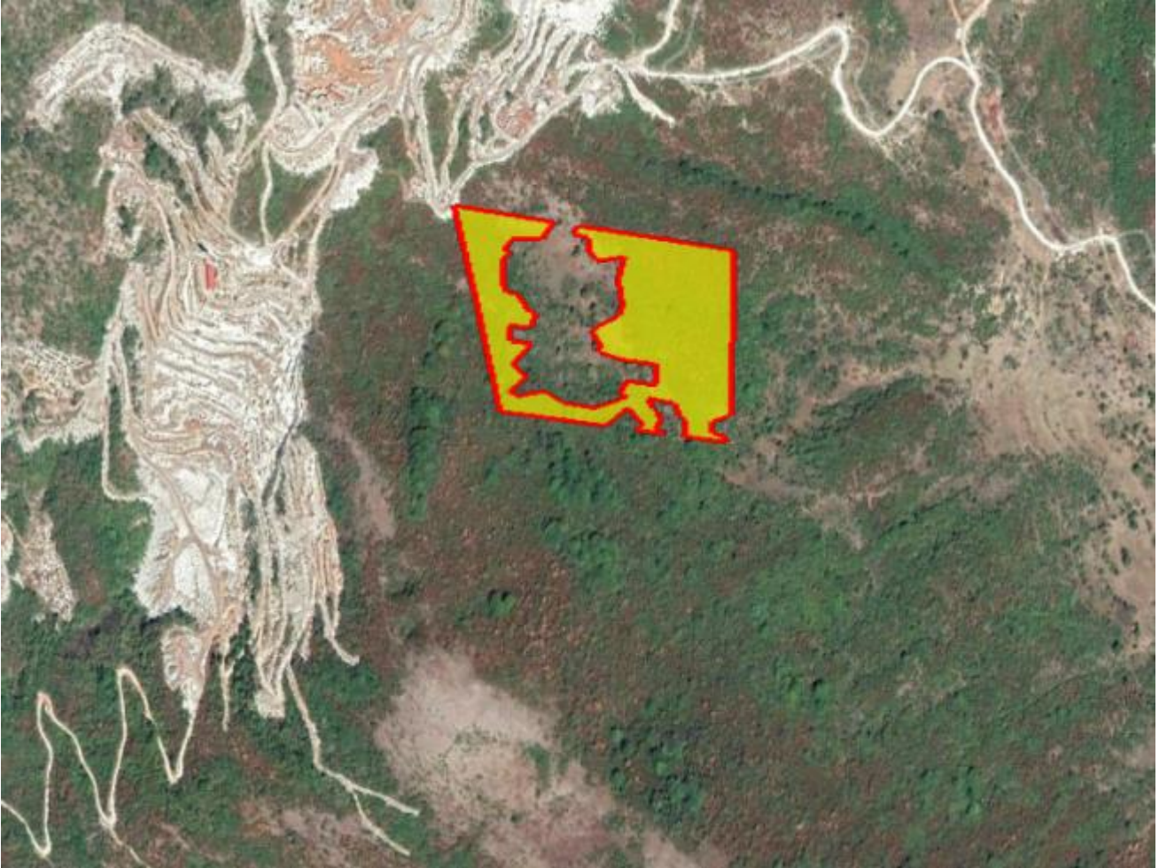
Απόσπασμα Google Earth.