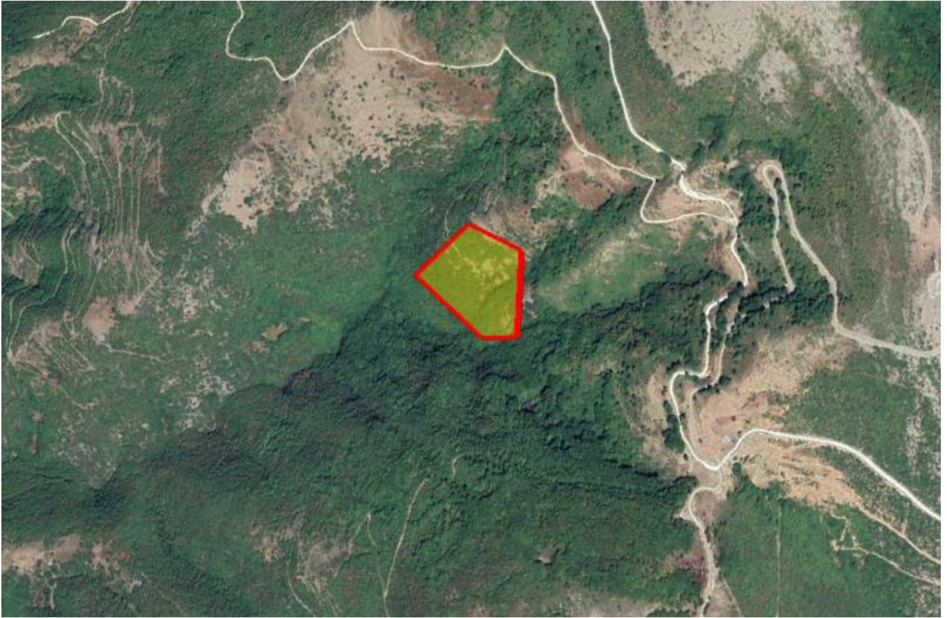
Απόσπασμα Google Earth.