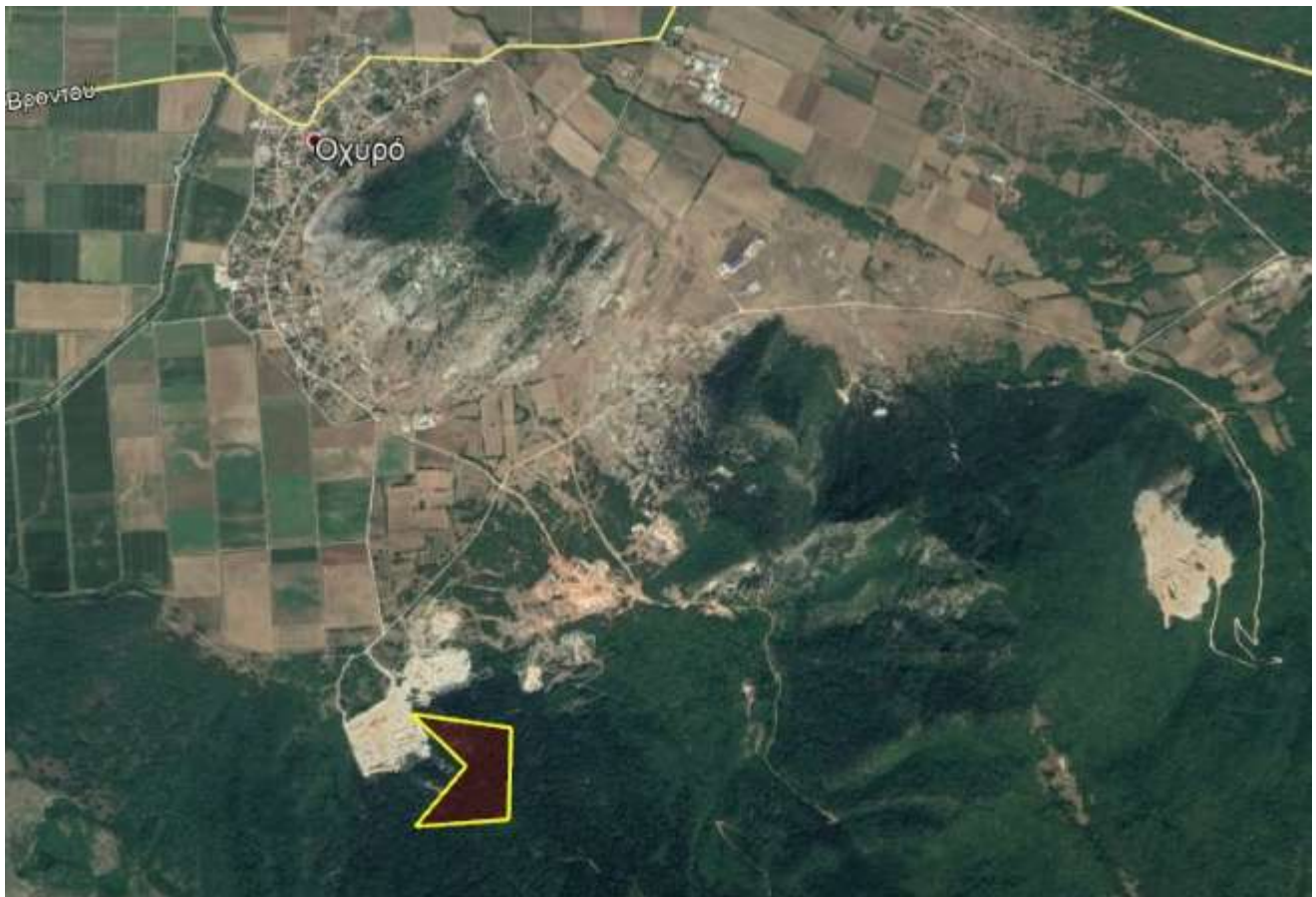
Απόσπασμα Google Earth.