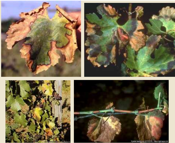
Εικόνα 4: Συμπτώματα του Xylella fastidiosa σε άμπελο («ασθένεια του Pierce»).

Η ξήρανση περιβάλλεται από κίτρινη ή κοκκινωπή ζώνη. Μετά την πτώση του φύλλου ο μίσχος παραμένει προσκολλημένος στην κληματίδα. Παρατηρείται ανομοιόμορφη ωρίμαση των κληματίδων, καθώς και μικροφυλλία και χλώρωση που θυμίζει τροφопενία.