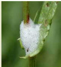
Προσβολή από νύμφη