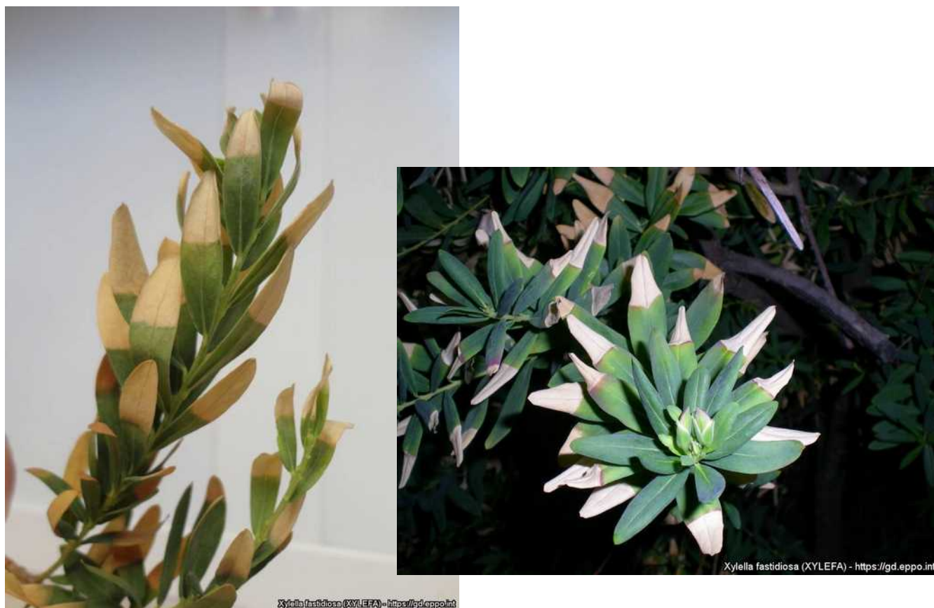
Συμπτώματα προσβολής από Xylella fastidiosa σε πολύγαλα (καλλωπιστικό φυτό).