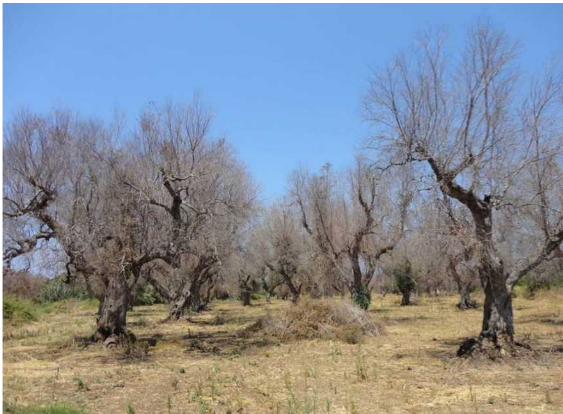
Προσβεβλημένα ελαιόδενδρα από Xylella fastidiosa στην Απουλία.