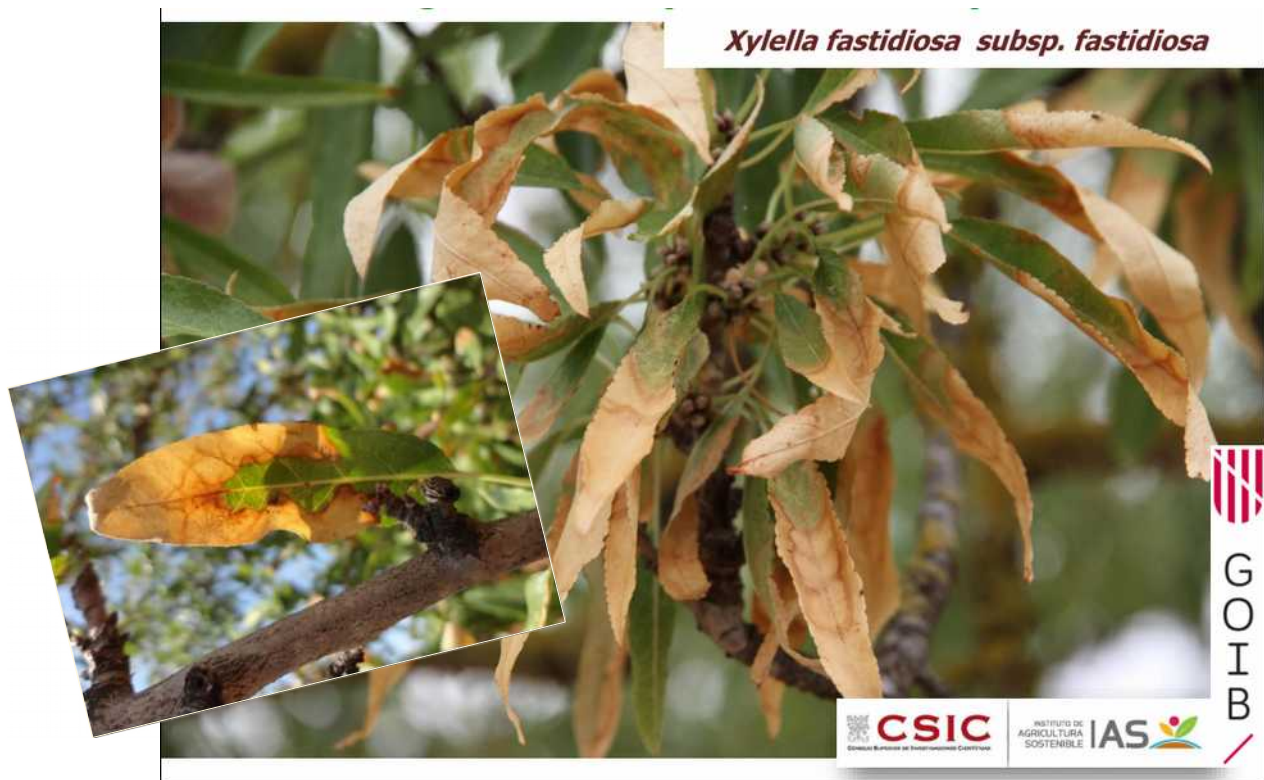
Συμπτώματα προσβολής αμυγδαλιάς από Xylella fastidiosa.