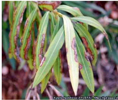
Εικόνα 3: Συμπτώματα του Xylella fastidiosa σε πικροδάφνη. (Πηγή: EPPO).

Το βακτήριο έχει πολλά υποείδη και πολλούς ξενιστές. Οι κυριότεροι ξενιστές του είναι η ελιά , η άμπελος , η αμυγδαλιά , η ροδακινιά , η βερικοκιά , η δαμασκηλιά , οι βελανιδιές , τα εσπεριδοειδή , η μηδική , διάφορα ζιζάνια όπως ο βέλιουρας και άλλα. Εκτεταμένες περιοχές με ελαιώνες στην Ιταλία και Ισπανία έχουν προσβληθεί από το παθογόνο. Ειδικότερα, ευπαθή φυτά στο στέλεχος του βακτηρίου που προσβάλλει την ελιά είναι και τα παρακάτω είδη: αμυγδαλιά, κερασιά, τομάτα, μελιτζάνα, δενδρολίβανο, μυρτιά, σπάρτιο, ράμνος και πολλά άλλα καλλωπιστικά (βλ. πίνακα φυτών-ξενιστών, σελ. 4 ).