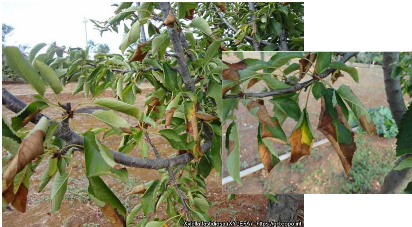
Συμπτώματα προσβολής κερασιάς από Xylella fastidiosa (Πηγή: EPPO).