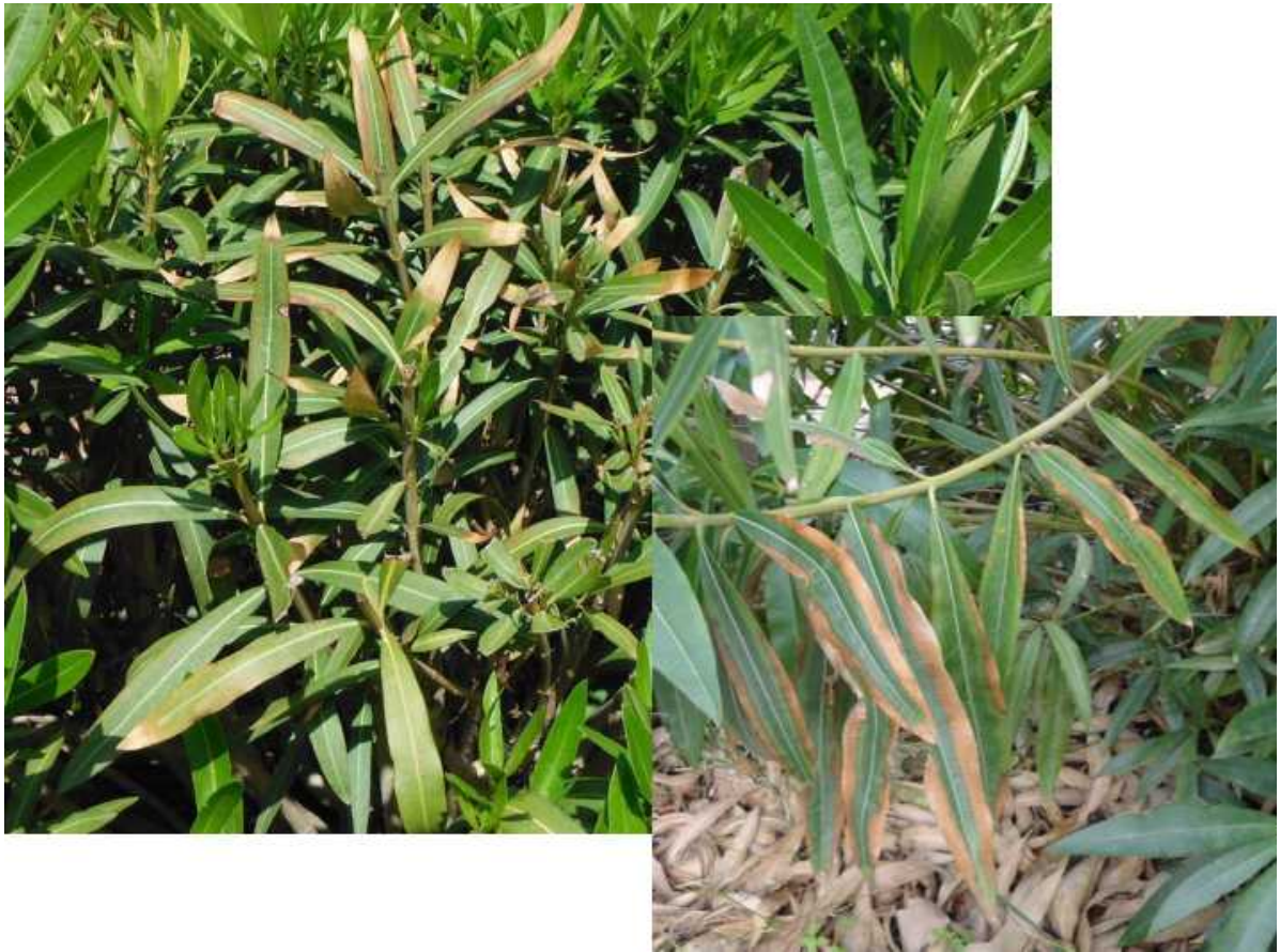
Συμπτώματα προσβολής πικροδάφνης από Xylella fastidiosa.