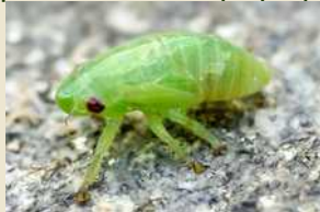
Νύμφη (μετά την αφαίρεση του αφρού που παράγει)