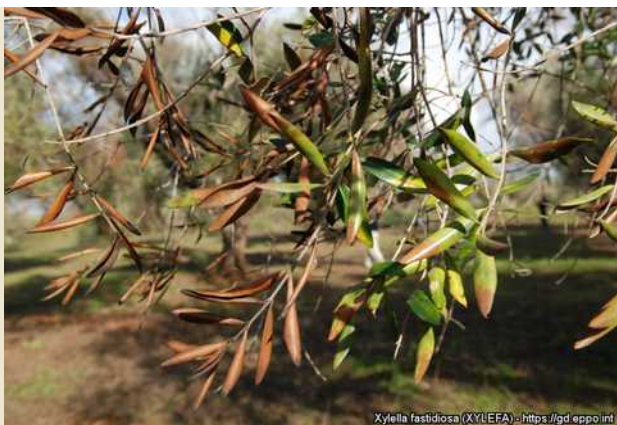
Εικόνα 1: Συμπτώματα του Xylella fastidiosa σε ελιά.

Η ασθένεια επιβεβαιώθηκε στην ελιά, αμυγδαλιά, πικροδάφνη, καρυδιά, κερασιά, βερικοκιά, άμπελο, λεβάντα, πελαργόνιο, δενδρολίβανο και πολλά άλλα φυτά, με συμπτώματα ξηράνσεων στα φύλλα και ταχύτατης αποπληξίας κατά τις θερμές περιόδους του έτους. Το εν λόγω παθογόνο εντάχθηκε από το 2014 στο ετήσιο πρόγραμμα επισκοπήσεων επιβλαβών οργανισμών, για τη διαπίστωση της παρουσίας του ή μη στη Χώρα μας και της τυχόν διασποράς του.