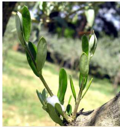
Εικόνα 6: Προσβολή ελιάς από νύμφη (μέσα στον αφρό που παράγει) του εντόμου Philaenus spumarius σε περιοχή της Π.Ε. Δράμας. Το έντομο είναι κοινότατο στη Χώρα μας και συναντάται τόσο σε αυτοφυή φυτά, όσο και σε καλλιεργούμενα.

κοινότατο στη Χώρα μας (Εικόνες 5 και 6). Η μετάδοση γίνεται ταχύτατα, ύστερα από δύο ωρών διατροφή του εντόμου σε μολυσμένο φυτό, χωρίς να μεσολαβεί κάποια περίοδος επώασης στον φορέα και το έντομο παραμένει μολυσματικό σε όλη την διάρκεια της ζωής του.